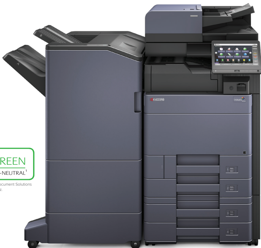
Abbildung mit Optionen.